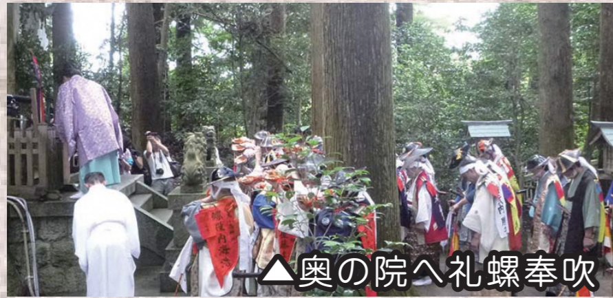
▲奥の院へ礼螺奉吹

午前9時30分 式典開始【相馬小高神社】 奥の院へ礼螺奉吹 45分 拝殿前で御発輦式執行 修祓、礼螺奉吹、祝詞奏上、玉串奉奠、 挨拶、訓示、御神酒拝戴 10時30分 御発輦 宵乗り行列（お繰り出し）開始